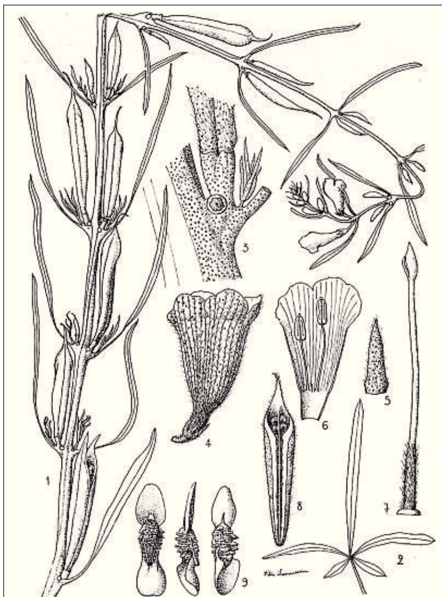
FIG. 155. — Sesamum alatum Thonn.

1. Rameau fleuri et fructifère réduit aux 2/3. — 2. Feuille réduite aux 2/3. — 3. Mode d'insertion de la feuille et du fruit. — 4. Fleur \times 2 . — 5. Sépale \times 6 . — 6. Partie de la corolle, face interne, et étamines \times 2 . — 7. Pistil \times 4 . — 8. Coupe du fruit, gr. nat. — 9. Graine \times 4 , sur trois faces.