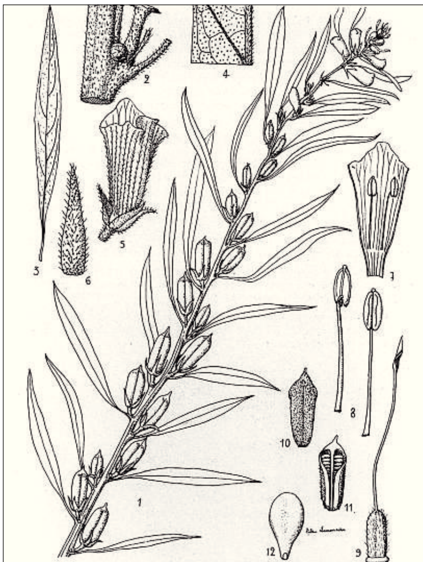
FIG. 156. — Sesamum indicum L.

1. Rameau feuillé, fleuri et fructifère. — 2. Mode d'insertion du fruit et de la feuille. — 3. Feuille, gr. nat. — 4. Nervation du limbe, face inférieure. — 5. Fleur \times 2 . — 6. Sépale \times 4 . — 7. Partie de la corolle, face interne, \times 2 . — 8. Etamine \times 4 , deux faces. — 9. Pistil \times 4 . — 10. Fruit, gr. nat. — 11. Partie du fruit, gr. nat. — 12. Graine \times 6 , face et profil.