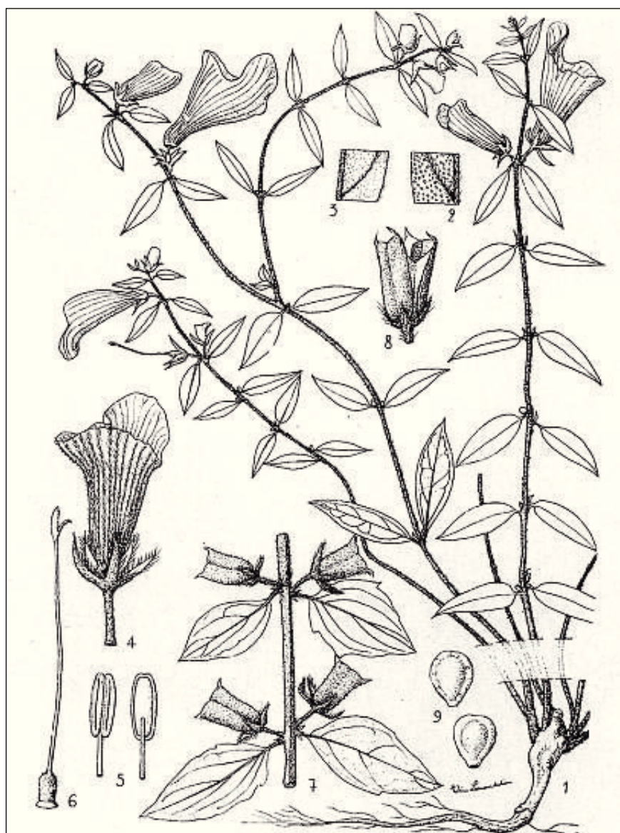
FIG. 154. — Ceratotheca sesamoides Endl.

1. Aspect général, réduit aux 2/3. — 2. Détail du limbe, face sup., \times 2 . — 3. Détail du limbe, face inf., \times 2 . — 4. Fleur, gr. nat. — 5. Anthère \times 4 , sur deux faces. — 6. Pistil \times 2 . — 7. Rameau fructifère réduit aux 2/3. — 8. Fruit ouvert, gr. nat. — 9. Graines \times 4 .