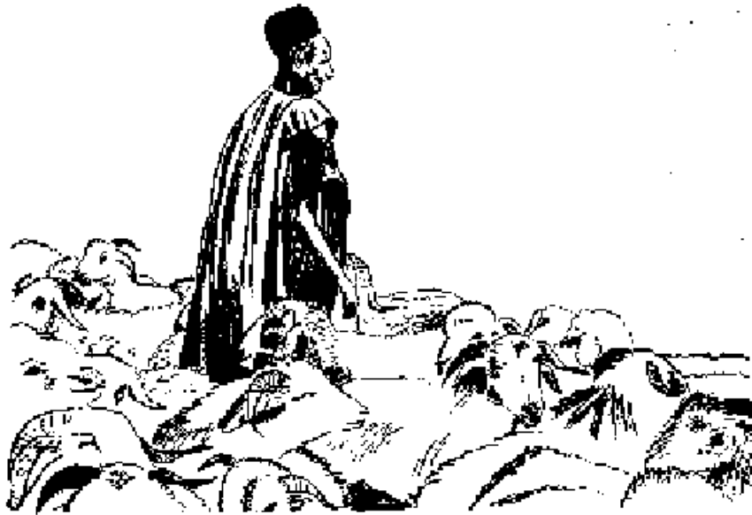
Kagume n da jexe n xobo

Hadamaaxu n ga na duguta salle n na, i na daga moodi n rondi i xoje n na ; i na ri daga debigume n xa tumsi i ka n na. Kagume su na i jexe n xurusi. Debe n su na kafi xadi na gunbo kari ; i na a saada dinde n wure. Kinsiga n ga na kinye, yaraxato n yige falle, yaxannu n na dinmu n sigindi karobera n a. I na sanga ma wuro n jenge. Baano n salle n na o maxa nyaxa xooze ya. Dingiro yogoni, salle n na bito filli ya nyaana ; a do gundu-n-gollu n ga ma gemu.