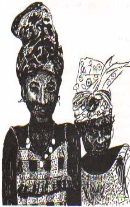
yaxannu n soyi