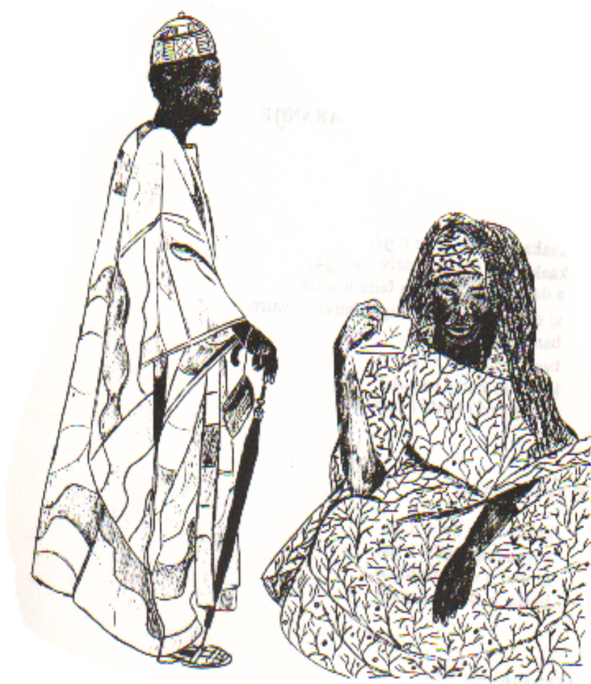
kaaka do naana