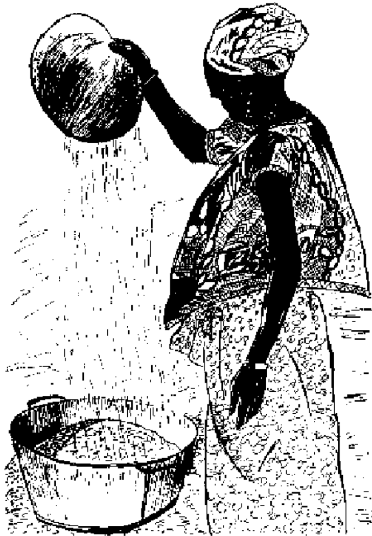
woyindaana n faayi