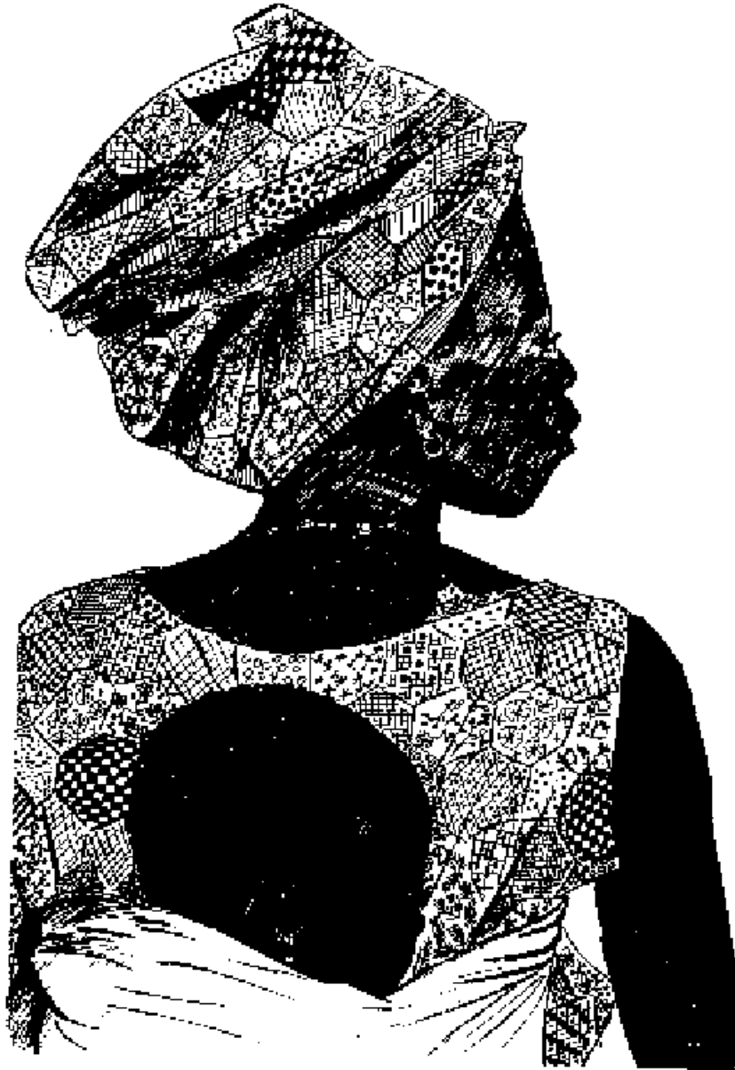
Fenda wa bandundiini