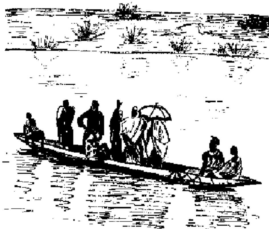
fuure n dangi fanηe n ηa