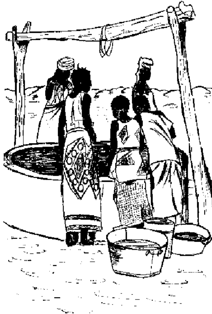
yaxaru n daga ji-wuti ke gede yi