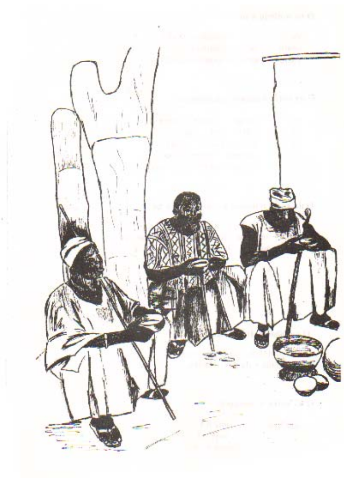
Yugu n duguta yigeye n ɲa